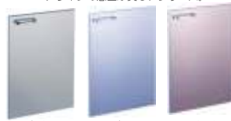
クリア スカイ チェリー

ステンシア/ステンレスヘアライン仕上げ ステンレスの特徴ともいえるヘアラインの意匠が美しいシリーズ。