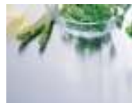
ステンレスヘアライン